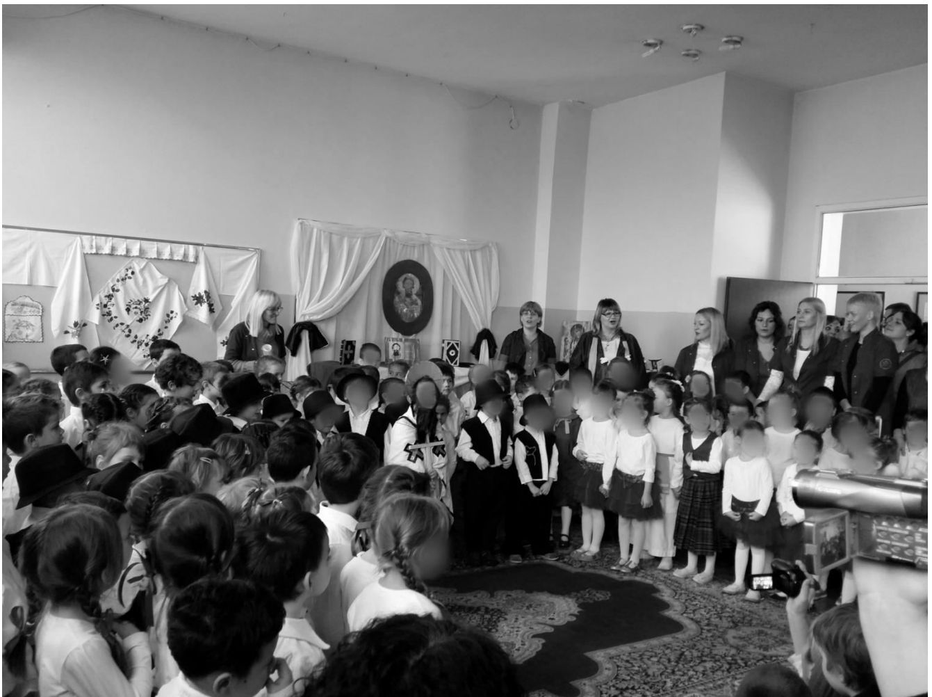
Деца и васпитачи вртића «Бошко Буха» на традиционалној прослави школске славе Свети Сава