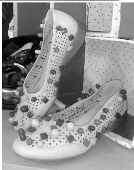
ципеле за акупунктуру :).