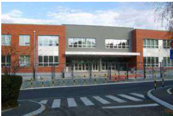
СРЕЋНО ДРАГИ УЧИТЕЉИ И ЂАЦИ!

Како би транзиција од вртића до школе била успешно и незаборавно путовање за дете и породицу, ми из вртића Сунцокрети смо се са учитељима, педагозима и психолозима ОШ „Милена Павловић Барили“ повезали како би омогућили успостављање партнерства ради остваривања добробити детета.