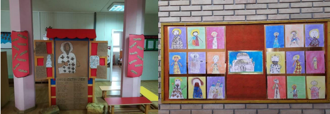
Ходник вртића „Дунавска бајка“

27. јануар нам је резервисан за прославудана Светог Саве. Без обзира што је ове године, овај дан био у суботу, у свим нашим вртићима су се одржале приредбе, на којима су деца рецитовала стихове, певала химну. У објектима се простор прилагођавао потребама прослава, ходници и собе су били у духу Светог Саве.