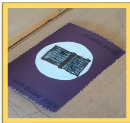
Школа у очима једног предшколца