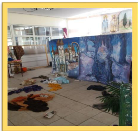
Неред које су оставиле Снежане

За крај посете, приређена је изложба „Вулкани”, а учитељице и васпитачи одговарали су на питања деце. Макете вулкана правили су ученици, а израђене су од различитог материјала и у различитим ликовним техникама.